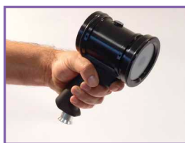
Projecteur UV S-LED