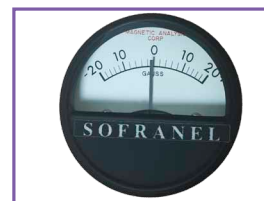
Indicateur de rémanence M5