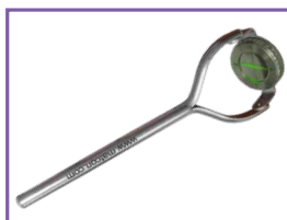
Croix de Berthold